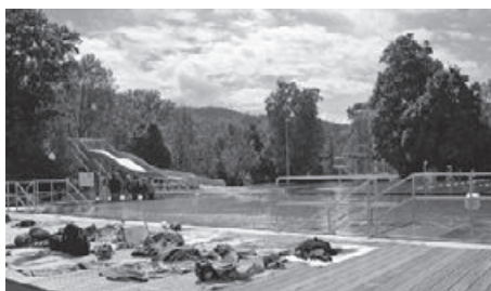
Die neu sanierte Badi mit dem Sprungturm rechts und der beliebten Breitwellenrutsche links.

Für 3.5 Millionen Franken ist die 63-jährige Talschaftsbadi im Schinzbacher Schachen erneuert und erweitert worden. Hauptattraktion an der Einweihung vom 20. Mai 2017 und während der ganzen Badisaison ist die neue Breitwellenrutsche, die via einer Crowdfunding-Sammelaktion mit 120'000 Franken finanziert werden konnte.