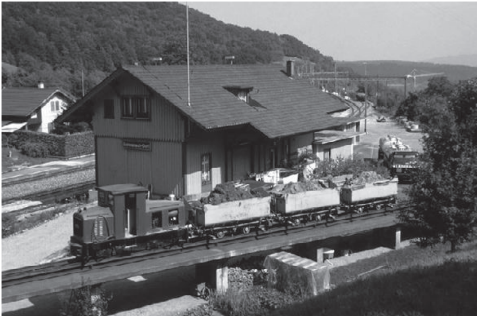
Die Materialbahn mit der Diesellok auf dem Verladegleis vor dem Bahnhof Schinznach-Dorf.