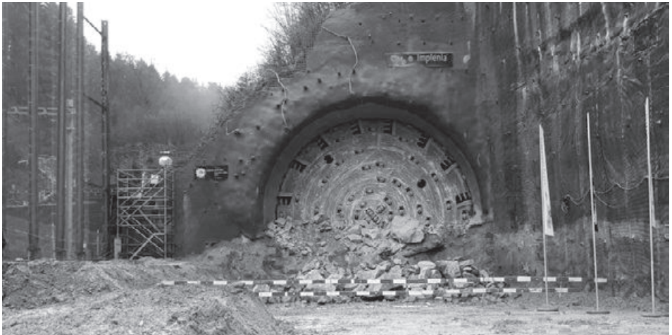
Durchschlag der Tunnelbohrmaschine in den Voreinschnitt Effingen am 29.11.2017.