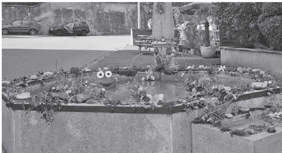
Der Schulbrunnen war am fantasievollsten geschmückt und sorgte für viel Aufmerksamkeit.