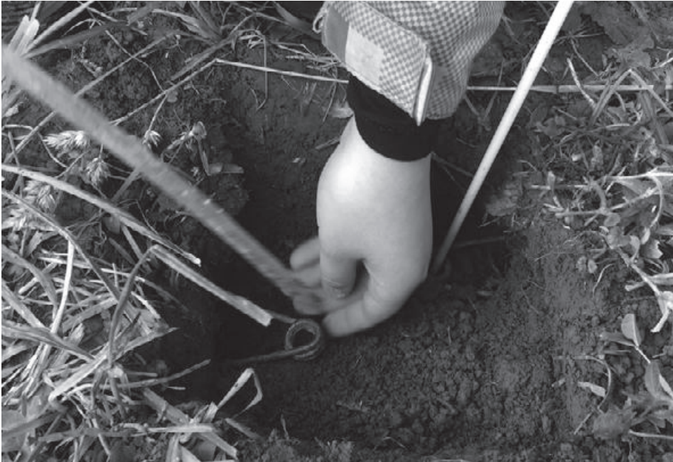
Die Mausefalle wird mit dem Zweig gesichert.

bleibt, wird die Stelle mit Erdballen wieder zugedeckt.