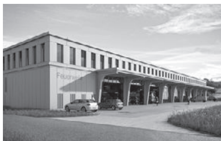
Modellansicht Gewerbepark mit Feuerwehrmagazin.

Die Feuerwehr Schenkenbergtal betreibt zwei Feuerwehrmagazine an den Standorten in Schinznach-Bad und im Ortsteil Schinznach-Dorf der Gemeinde Schinznach, welche jedoch nicht mehr den aktuellen Anforderungen entsprechen. Gemäss Leistungsnorm der Aargauischen Gebäudeversicherung eignet sich der neue Standort im Gewerbepark der Firma Samuel Amsler AG optimal. Der Gemeinderat hat das Baugesuch der Samuel Amsler AG für den Gewerbepark inkl. Feuerwehrmagazin am 16. Oktober 2017 genehmigt.