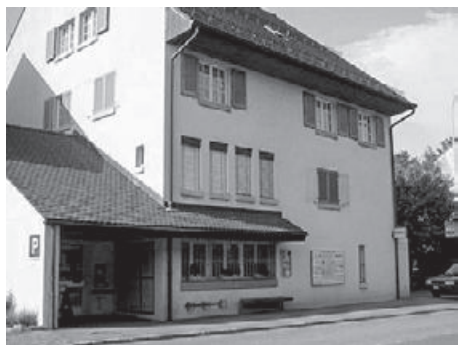
Die Poststelle von Schinznach-Dorf, Oberdorfstrasse 6.

Die Post hat die Schliessung von weiteren 500 bis 600 Poststellen bis ins Jahr 2020 angekündigt. Der Gemeinderat erkannte, dass