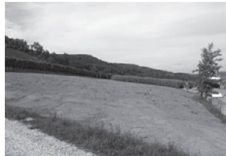
Kugelfangbereich nach der Sanierung beziehungsweise der Rekultivierung am 16. August 2017.