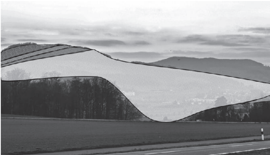
Vereinfachte, schematische Darstellung der geologischen Verhältnisse: die an der Oberfläche liegenden Gesteinsschichten und ihre überlagernden Lockersedimente.

Die Schätze des Schenkenbergertales mögen auf den ersten Blick recht überschaubar sein. Dennoch finden sich im Tal Reichtümer verschiedenster Art. Einerseits liegen hier wichtige Rohstoffe aus verschiedenen Erdzeitaltern, auf die jeder von uns angewiesen ist. Diese wurden und werden auch heute noch zum grossen Teil für bauwirtschaftliche Zwecke eingesetzt. Wurde früher noch jahrzehntelang der jurassische Ton aus der