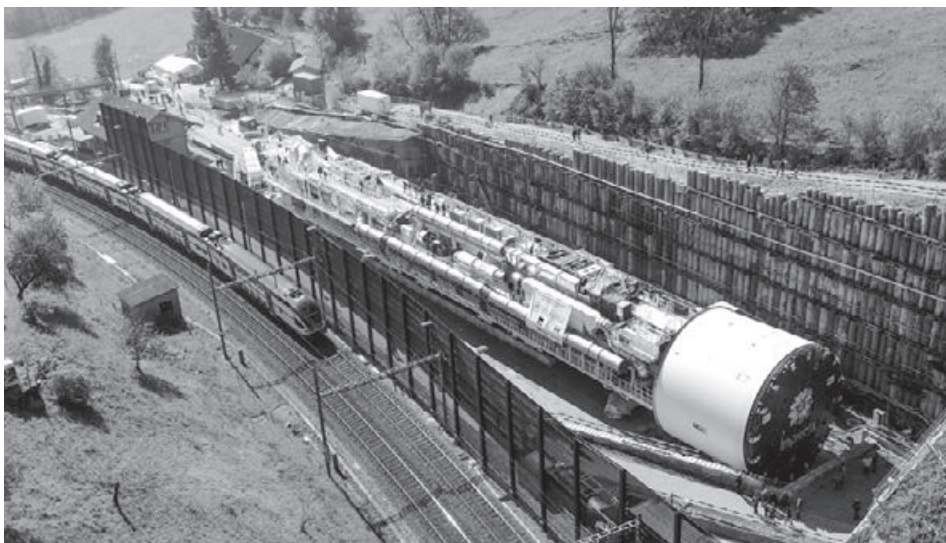
Fertig montierte Tunnelbohrmaschine am Tag der offenen Baustelle am 29.04.2017.

Der bestehende Tunnel, welcher 1875 in Betrieb genommen wurde, wird anschliessend zum Dienst- und Rettungsstollen umgenutzt. Diese Arbeiten werden nach der Inbetriebnahme des Neubautunnels bis Mitte 2022 ausgeführt.