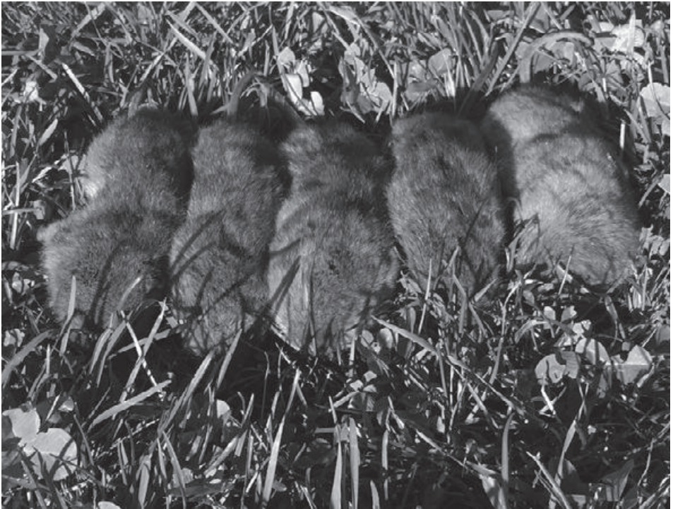
Aufgebessertes Taschengeld: fünf Mausschwänze gegen sechs Franken und fünfzig Rappen.

Text und Foto: Heinz, Tamara, Marc und Rebecca Simmen