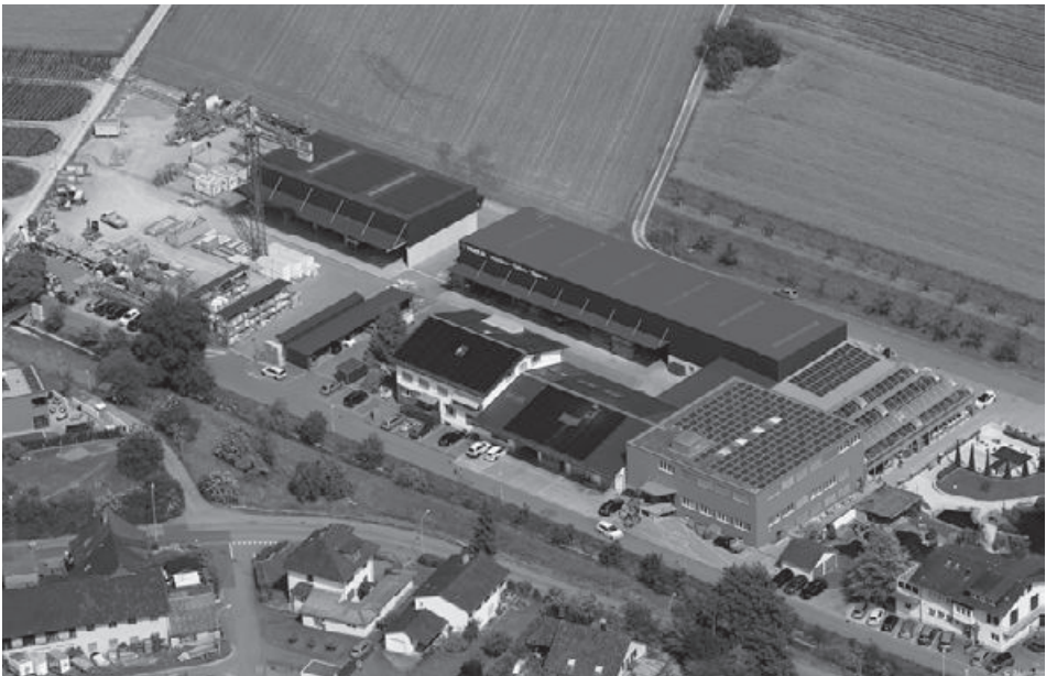
Luftbild der Treier AG vom 16. Juni 2017.