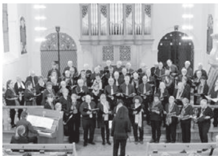
Konzert der vereinigten Chöre.

Thalheim, Schinznach und Veltheim können es musikalisch gut zusammen; die Zusammenarbeit der Gemischtenchöre Thalheim und Veltheim und des Chores Schenkenbergertal ist erfreulich und führt zu zwei tollen Konzerten. Das zahlreich anwesende Publikum wünscht sich eine baldige Wiederholung dieses Talschaftskonzertes.