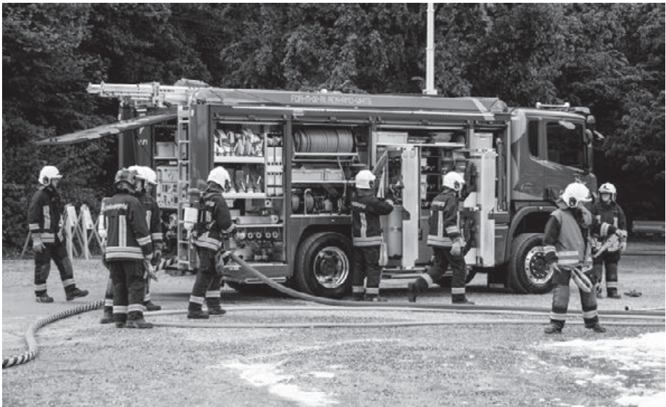
Unglaublich, wie viele Schläuche in diesem Fahrzeug Platz haben!

Die Regionale Feuerwehr Schenkenbergertal weicht mit einer Demonstration auf dem Feldschenplatz am 13. Mai ihr neues Tanklöschfahrzeug ein. Das imposante, nach einer speziellen Bedarfsliste angefertigte TLF mit einem Gesamtgewicht von 16 Tonnen basiert auf einem Scania Chassis, mit einem eingebauten SCR 9-Liter-Reihenfünfzylinder Dieselmotor, der 360 PS leistet.