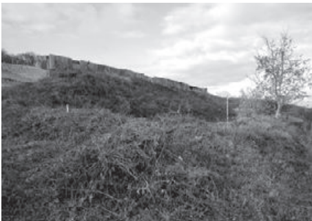
Kugelfangbereich vor der Sanierung: stark mit Sträuchern bewachsen am 29. Oktober 2015.

Am 19. Juni 2017 begann die Firma Knecht AG, Windisch, mit den Vorarbeiten und dem Pistenbau. Um eine optimale Zufahrt für die Lastwagen zu gewährleisten, wurde diese über die Schranstrasse in die Obere Rebbergstrasse