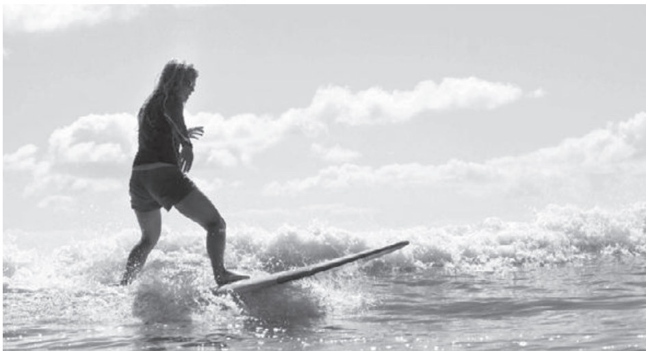
Beim Surfen in Honolulu, Hawai'i 2011.

Trotz der Verbundenheit zu Schinznach und dem abwechslungsreichen Alltag, den ich mir eingerichtet hatte, spürte ich noch immer die Wanderlust und den Ruf der Berge. Ich kündigte meinen festen Job in der Hutfabrik, um eine Saison in einer Skivermietung in Arosa zu arbeiten. Noch im selben Winter beschloss ich, mein liebstes Hobby zum Beruf zu machen und wurde in der darauffolgenden Saison Snowboardlehrerin in Davos. Ich liebte das Unterrichten, konnte ich doch meine Passion an die nächste Generation weitergeben. So musste ich keine Sekunde lang überlegen, als mir ein Job in einem winzigen Skigebiet auf der Südinsel von Neuseeland angeboten wurde.