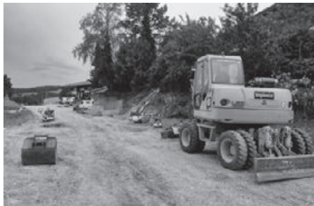
Grossbaustelle Veltheimerstrasse: es blieb kein Stein auf dem andern!

2017, sechs Wochen vor dem prognostizierten Bauende, konnte das Bauwerk eingeweiht und dem Verkehr übergeben werden.