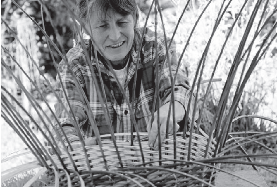
Flechten eines Erntekorbes mit gespaltenen Weiden (Oktober 2017).

viel Arbeit. Einen Preis festzulegen, ist nicht einfach. Die Körbe sollen bezahlbar sein, doch als nebenberufliche Korberin soll ich auch etwas einnehmen. Ich stelle Erntekörbe, Einkaufskörbe und „Chriesichratte“ her und erfülle auch individuelle Wünsche. So habe ich schon einen Babykorb, einen Hochzeitskorb und einen Urnenkorb hergestellt, Körbe „von der Wiege bis zur Bahre“. Die Leute bringen mir auch kaputte Lieblingsstücke. Beim Flickern lerne ich immer wieder andere Techniken und Tricks kennen.