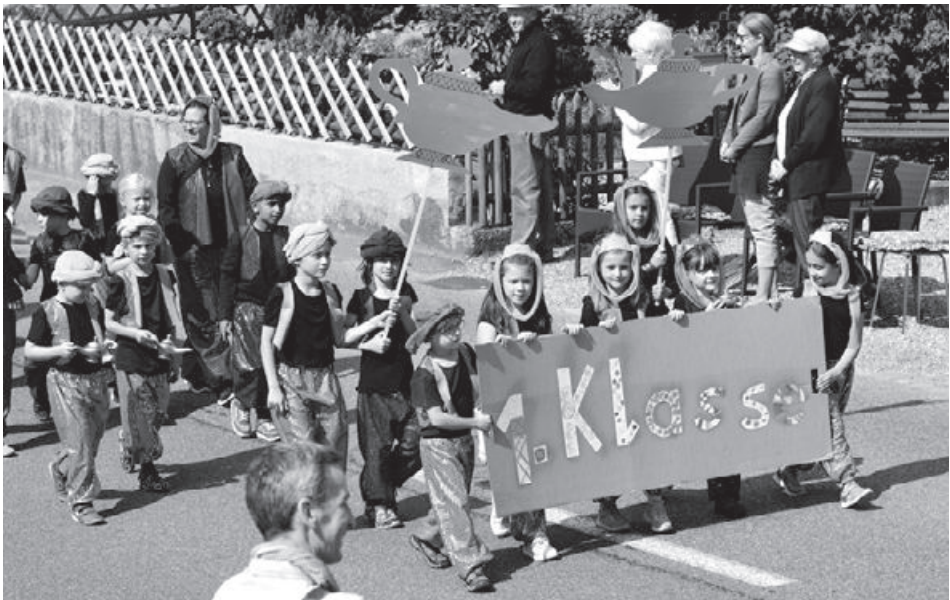
Beim Festumzug wurde das Motto „Fantasy“ wirkungsvoll umgesetzt.

In den Wochen vor dem Jugendfest und in der Projektwoche entstanden neben dem Schuljahresendspurt fantasievolle Kostüme und unzählige Dekorationen. Es war schön mit anzusehen, wie viele tolle Ideen umgesetzt wurden.