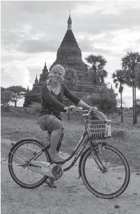
Vor dem Tempel: Bagan, Myanmar 2013.

Zurückblickend auf meine Kindheit haben in meiner Brust wohl schon immer zwei Herzen geschlagen. Ich kann mich noch ganz klar an den kleinen, pinken Rucksack erinnern, den ich immer fertig gepackt bereit hatte. Nur falls meine Eltern mal gemein genug gewesen wären und ich einen Grund gehabt hätte wegzulaufen, hinaus in die grosse weite Welt. Da dieser Fall aber nie eintraf, verbrachte ich meine Zeit dann doch damit, mit meinen Puppen den häuslichen Alltag nachzuspielen, der mir von meiner Familie vorgelebt wurde. Ich war lange sesshaft im Schenkenbergertal und Vieles war für mich selbstverständlich.