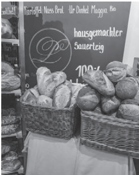
Ruch- und Halbweissbrot mit 18 Stunden Teigruhe im neuen Ladenlokal Schinznach-Dorf.

Während der eine nun den Teig portioniert, formen die anderen von Hand die Teigstücke zur richtigen Form und legen ihn auf spezielle Wagen. Ist dieser voll mit den Teiglingen, «schießt» man alles in den Ofen ein. Wenn das Brot fertig gebacken ist, wird es von Hand mit einem Brotschüssel herausgeholt