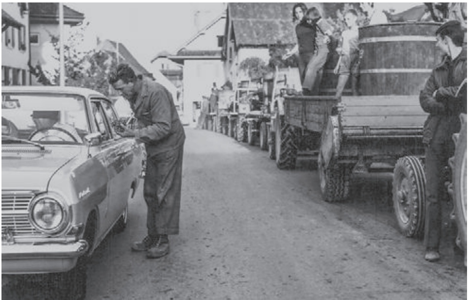
Geduldiges Warten auf die Traubenabgabe entlang der Kirchenmauer an der Unterdorfstrasse, Schinznach-Dorf.

Anfangs der 70er Jahre wurde dieses Wachstum gestoppt. Das Einkaufs- und Konsumverhalten der Bevölkerung begann sich zu ändern. Einkaufszentren entstanden. Grosse Lebensmittelhändler bauten ihr Filialnetz auf und konnten Produkte mit tiefen Verkaufspreisen