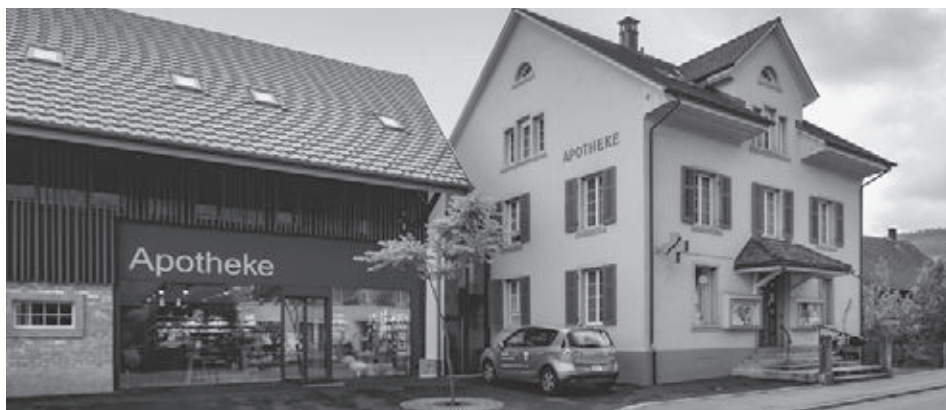
Die neue Apotheke im ehemaligen Stall links und die alte Apothekenliegenschaft rechts.