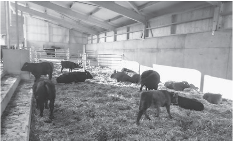
Die Angus-Rinder fühlen sich in der offenen Liegehalle mit Tiefstreu wohl!