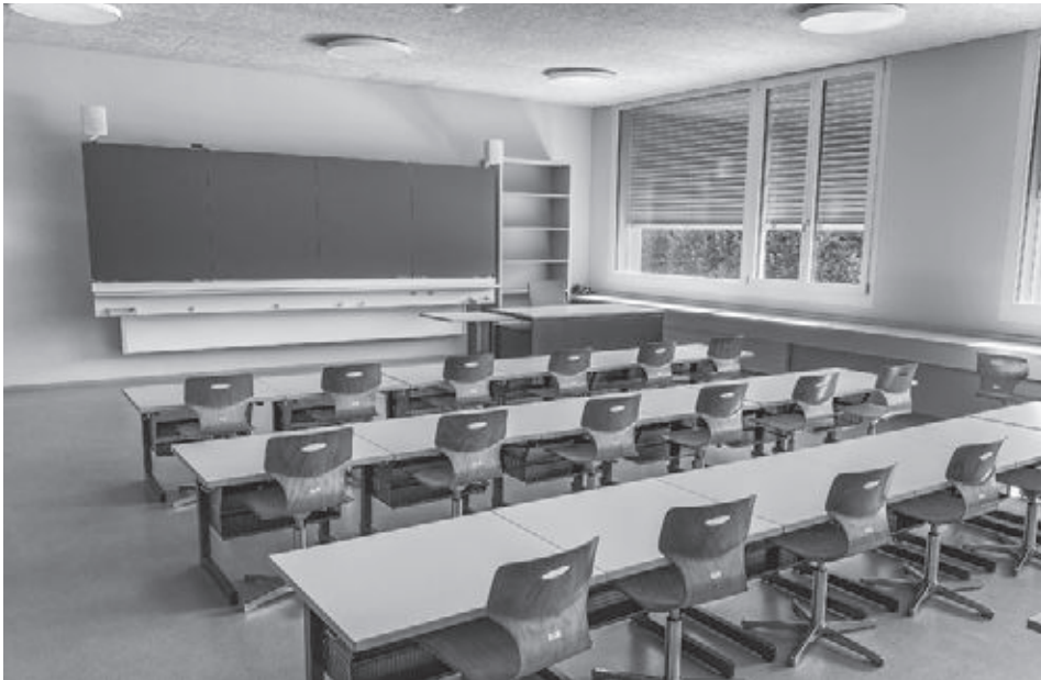
Schulzimmer mit Wandtafel mit integriertem Display im Obergeschoss des neuen Schulhauses.

Das Schulhaus Feldschen ist an die bestehende Holzsnitzelheizung angeschlossen und weist ein bestehendes Sockelgeschoss aus Beton auf. Darin sind die gegen das Dorf ausgerichtete Aula, das Foyer, eine Küche sowie Material- und Technikräume untergebracht. Die beiden darüberliegenden Stockwerke bestehen aus vorgefertigten Holzelementen und beinhalten sechs Schulzimmer, drei Gruppenräume sowie ein Lehrerzimmer. Das Treppenhaus ist mit einem grossen Oberlicht versehen, welches viel Tageslicht ins Ober- und Erdgeschoss hineinlässt. Die hellen Schulräume mit den warmen Farben sind mit Lüftungsanlagen ausgestattet und erfüllen die Anforderungen der neuen Lernformen des Lehrplans 21. Pro zwei Klassenzimmer ist je ein Gruppen-