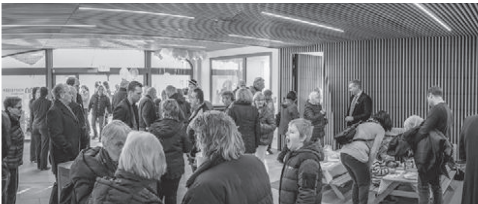
Eröffnung Raiffeisenbank Schinznach am 18. Januar 2020.

Text: Andrea Märki