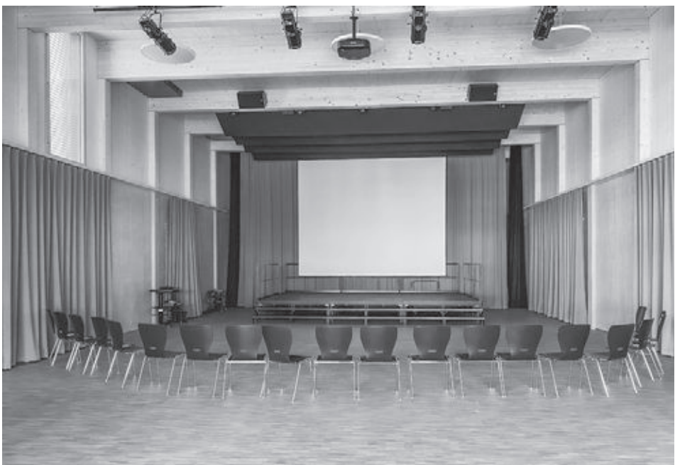
Die Aula mit der mobilen Bühne.

dadurch koordiniert abgewickelt werden. Das erstrebte Ziel, den Bau unfallfrei zu erstellen, wurde dadurch vollends erreicht. Bereits am 11. September 2019 erfolgte zusammen mit den zukünftigen Benutzern des Gebäudes und den Bauverantwortlichen eine feierliche Grundsteinlegung. In eine zugelötete Kupferkiste wurden von Primarschülern angefertigte Zeichnungen, Pläne, sowie Dokumente über die Einweihung der alten Aula aus dem Jahre 1923 sowie Unterlagen des Kulturgrundes und weiteres zeitgenössisches Material eingemauert.