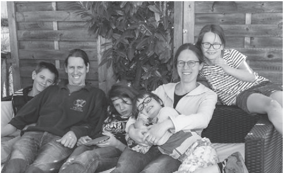
Tägliche Zvieripause zu sechst.

Viel Zeit für Familienprojekte: eine Namens-tafel für das ungeborene Kind meines Bruders kreieren oder den Garten zum ersten Mal bepflanzen. Die neuen Rezepte, die ich mit den Kindern ausprobiert habe: Einiges ist in den Rezeptordner gewandert, anderes direkt ins Altpapier.