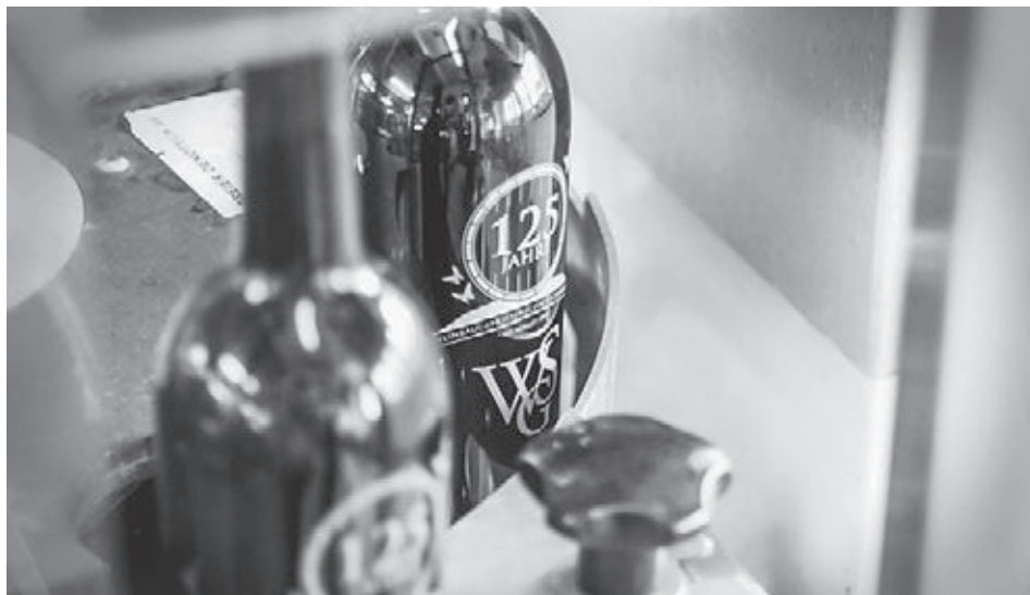
Limitierte Abfüllung des Jubiläumsweines 125 Jahre Weinbaugenossenschaft, erhältlich als Pinot noir und Riesling-Sylvaner.