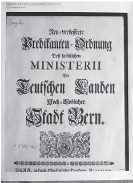
Predikanten-Ordnung der sämtlichen Ministerii der Teutschen Landen hoch-loblicher Stadt Bern von 1748.

Stadtschulen gab es schon im 13. und 14. Jahrhundert. In Kloster- oder Lateinschulen wurde der Nachwuchs für den Kirchendienst in lateinischer Sprache und in Muttersprache für das bürgerliche Leben gelehrt und geübt. Die Landschulen, erst seit der Reformation allmählich entstanden, hatten rein kirchliche Lernziele, so wurden auch die Belange der Schule nicht in einer Schulordnung sondern in der Bernischen Prädikantenordnung geregelt.