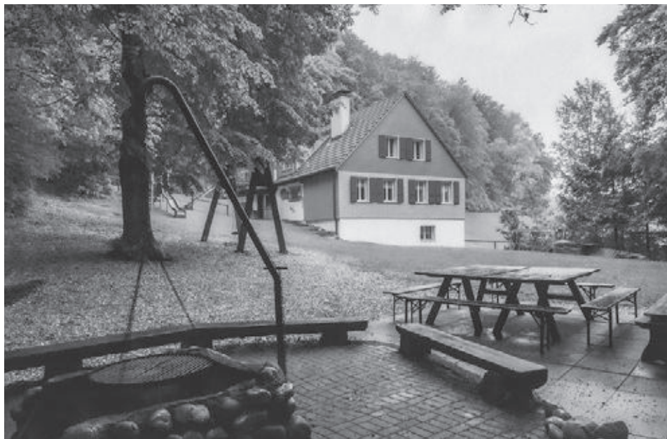
Das Haus und seine Umgebung ist der ganze Stolz der Naturfreunde Lenzburg.

Text: Hanspeter Burkard