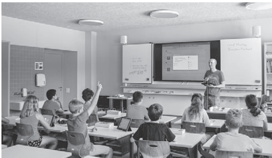
Die Vorteile der Technik werden im Unterricht gewinnbringend eingesetzt.

In einem nächsten Schritt nahmen wir die Firma Anykey mit ins Boot, welche sich auf Begleitung von Konzeptarbeit an Schulen spezialisiert hat. Es gab eine intensive Zeit mit vielen Stunden Sitzungen, an welchen