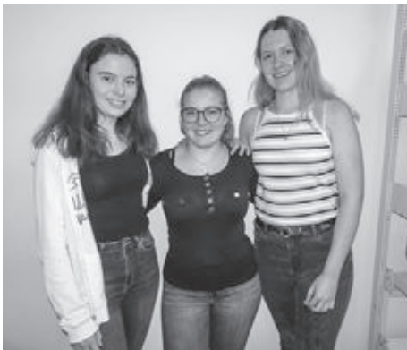
Foto links: Schinznacher-Teilnehmerinnen der Jungbürgerfeier vom 21. August 2020 .

Geplant war eine Bootsfahrt von Villnachern nach Brugg mit anschliessendem gemeinsamem Abendessen im Dolce Vita, Brugg. Wegen den Corona-Schutzmassnahmen musste das Programm kurzfristig geändert werden und die angemeldeten Jungbürgerinnen und Jungbürger wurden zu einem Nachtessen im Restaurant Weingarten in Thalheim eingeladen.