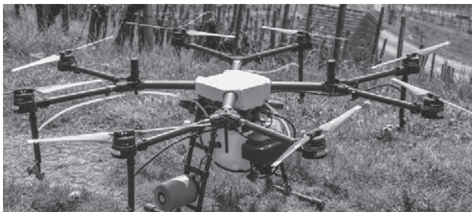
Drohne startbereit im Chalm.

Text: Familie Zimmermann