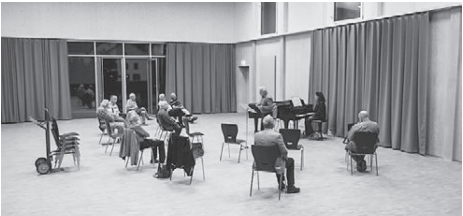
Chorprobe im September 2020 in der neuen Aula mit Schutzkonzept: reduzierter Bestand und zwei Meter Abstand.