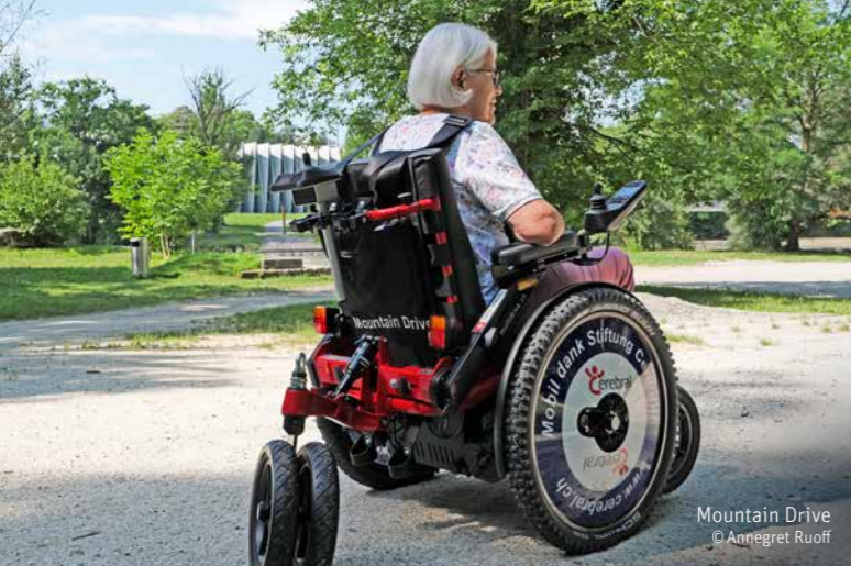
Mountain Drive