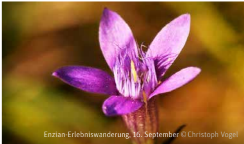
Enzian-Erlebnisswanderung, 16. September

Sa 16.09. | 13.30–16.15 ♀ Oeschgen ♀ Benno Zimmermann Pilze: Die heimlichen Herrscher WEITERE DATEN