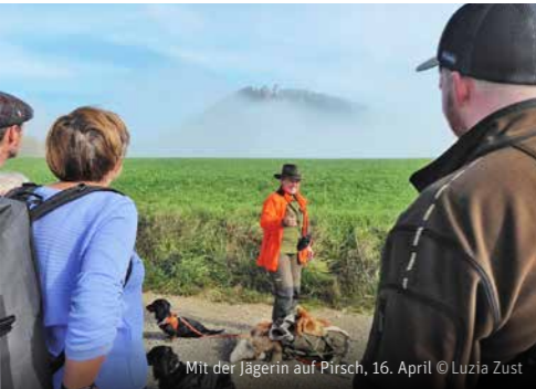
Mit der Jägerin auf Pirsch, 16. April

So 26.03. | 09.30–11.30 ♀ Bözberg ♀ Luzia Züst Vogelxkursion: Gesänge im Frühlingswald