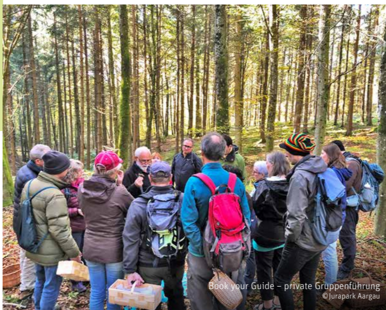
Book your Guide – private Gruppenführung